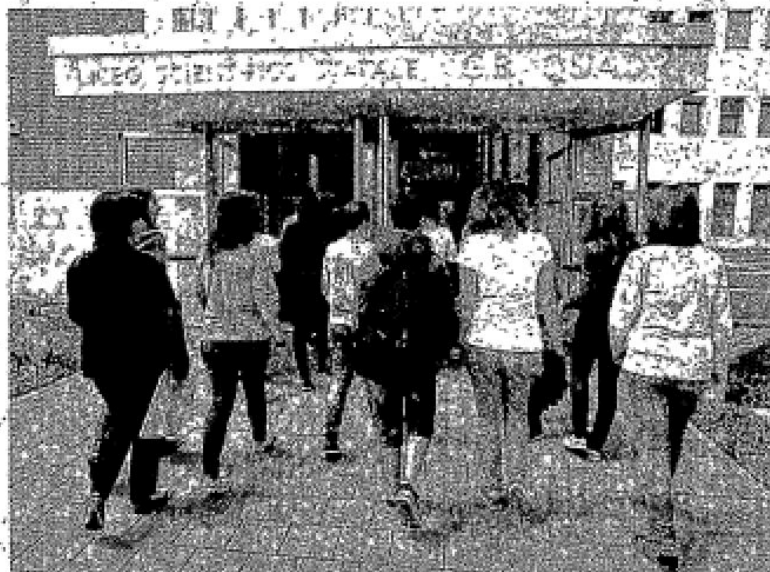
L'ingresso del liceo Quadri in via Carducci. Secondo Eduscopio, risulta tra i migliori licei d'Italia

Risultati? Per quanto riguarda i ventiquattro indirizzi di liceo scientifico dislocati nel raggio di una trentina di chilometri a salire il primo gradino del podio è appunto il Quadri (90,20), seguito a ruota da Corradini di Thiene (90,12) e dal Gian Giorgio Trissino di Valdagno (90,05). Al sesto posto il Fermi di Padova (89,13) e al settimo il Lioy di Vicenza (83,69). Tredicesimo lo scientifico del Fogazzaro (76,75), quattordicesimo il Da Vinci di Arzignano (75,06), sedicesimo il Masotto di Novanta Vicentina (73,2). Al ventidicesimo e ventiquattresimo posto due istituti paritari con indirizzo scientifico, rispettivamente il